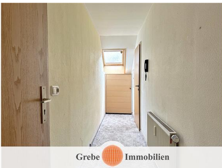
Flur in der Wohnung