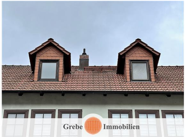
DG als 4. Etage